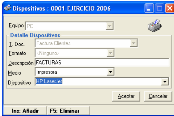
Figura 5.2 Selección de Dispositivo

Cuando entramos en la opción de añadir, o en modificación de una relación, aparece la pantalla: