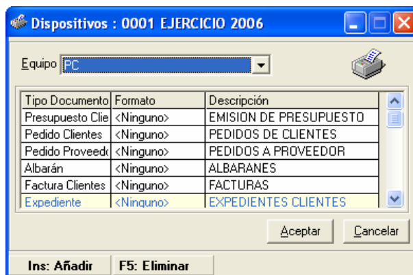
Figura 5.1 Dispositivos para Informes

Al entrar en esta opción aparecerá la pantalla